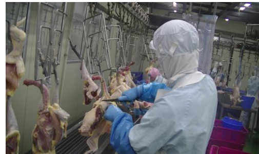
食鶏処理作業風景

三昌物産(株)は、今年7月1日付けで、タッキーフーズ(株)より、農場と処理場を譲り受け、杉本食肉産業(株)との共同出資によって、コーチンミライズ(株)を設立いたしました。もともと三昌物産も名古屋コーチン協会の小売部会には登録しているのですが、さらに生産に関わるコーチンミライズも協会に参加することになりました。