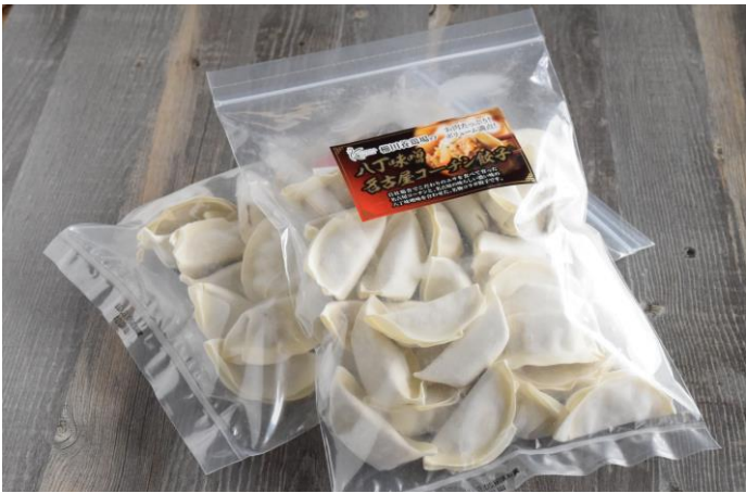
八丁味噌名古屋コーチン餃子