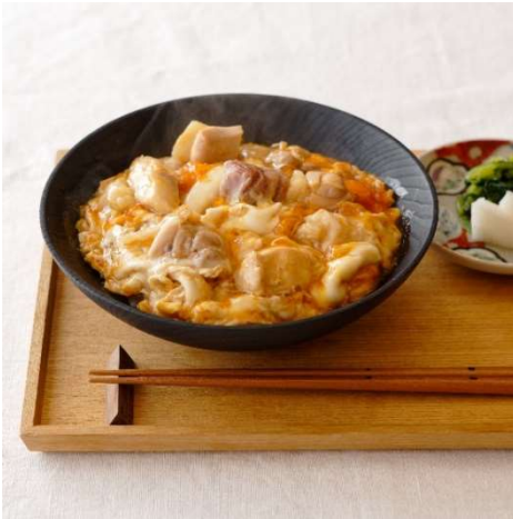
純系名古屋コーチンの親子丼