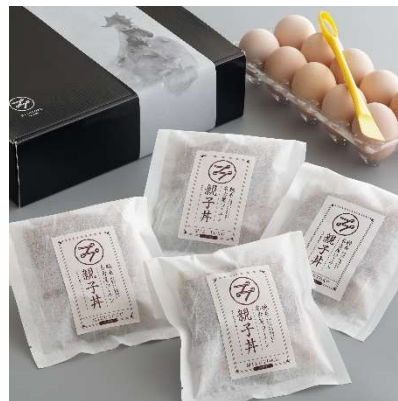
純系名古屋コーチンひきずり鍋セットと親子丼セット