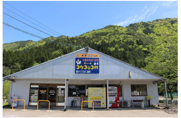
郡上八幡コケッコ村 (岐阜県郡上市)