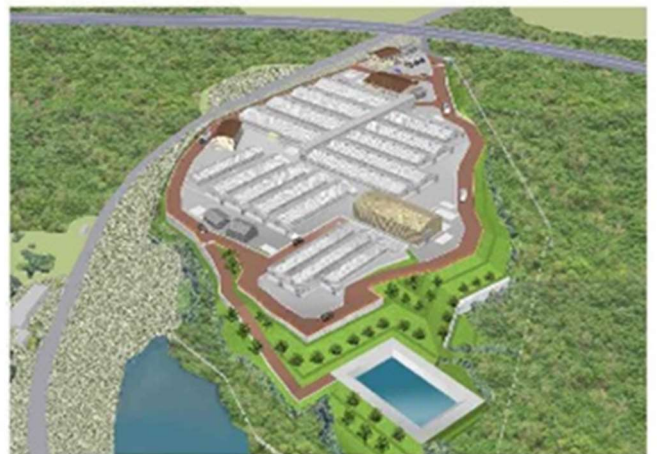
種鶏場完成予想図