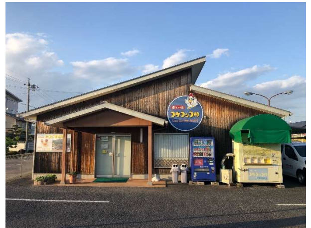
コケッコ村エッグガーデン (岐阜県美濃加茂市)

弊社は、昭和45年1月に豊橋飼料株式会社の鶏卵販売会社としてスタートいたしました。