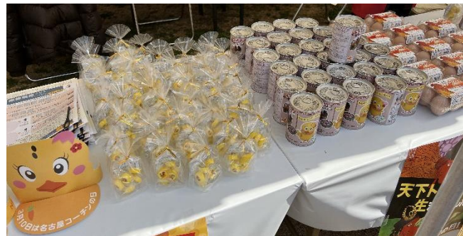
景品（コーチン卵、缶入りパン、飴）