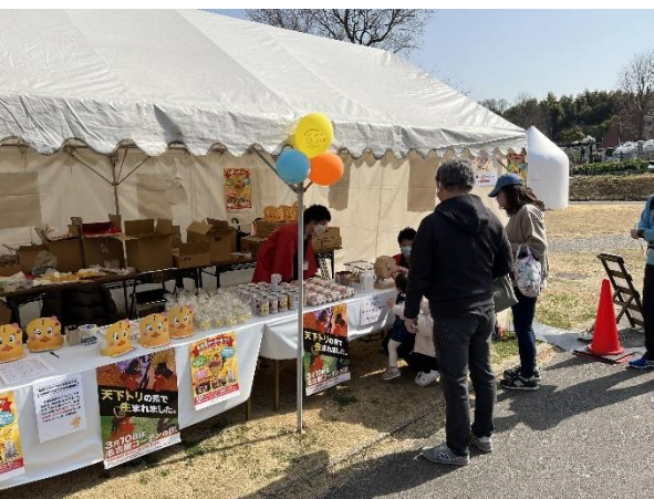
⑩ テント（クイズラリー景品交換所）