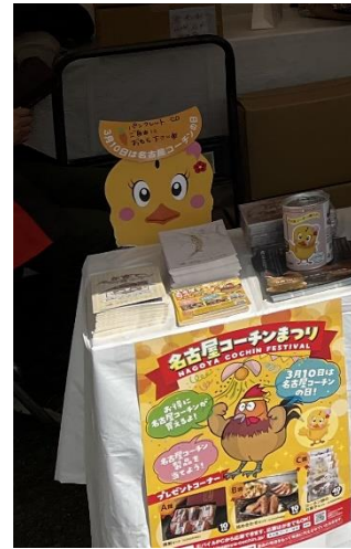
チラシ、コーチンレシピの配付