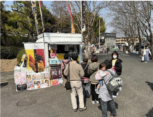
① キッチンカー(尾張志水家)