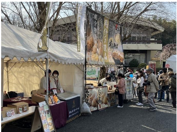
⑤ テント（小牧市商工会議所（手前））