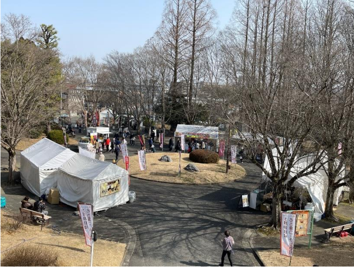
会場となった名古屋市農業センターロータリー