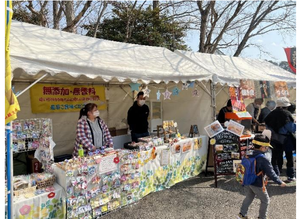
⑧ テント（ライフサポート）