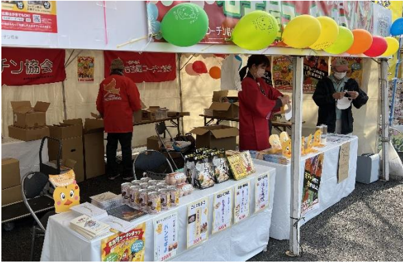
事務局のテント（テント⑨）