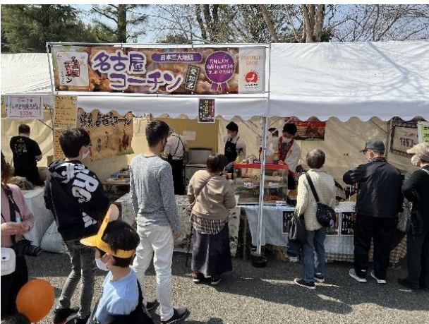
② テント(丸トポートリー食品)