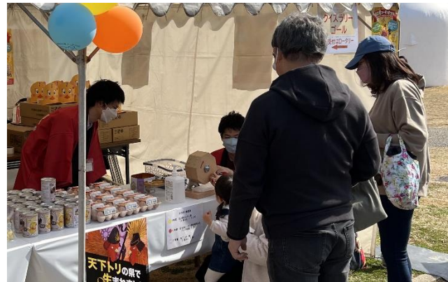
参加者へのガラポン抽選会