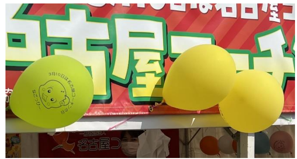
子供向けサンバイザーや風船の配付