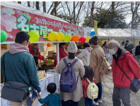
⑨ テント（コーチン協会）